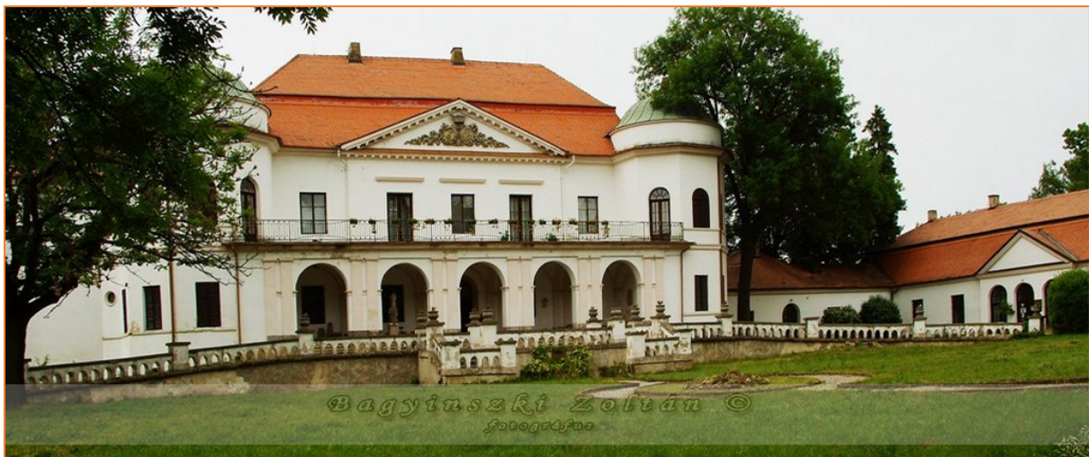
3. kép - Sztáray-kastély

Megemlítendő, hogy a hegyvidéki ruszinok (verhovinaiak) nyugati és középső törzsei (lemkók és bojkók) között a Laborc völgye képezi a határt.