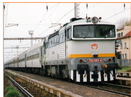
5. kép - A Laborc gyorsvonat az Ondava menti Bánócon

A Laborc nevet ma is használják személynévként, de a folyó völgyében számos vendéglátóhely viseli ezt a nevet. A mezőlaborci szállodának is ez a neve, mely stílszerűen a Warhol utcán található. A két háború közötti Csehszlovákia leghosszabb vasúti viszonylata a Prága – Kőrösmező között közlekedő gyorsvonat volt. Az ország zsugorodása következtében a Prága – Mezőlaborc közötti járat vette át a helyét, mely a Laborc nevet viselte, mintegy 800 km utat futta be. Az ország szétesése után is közlekedik a Laborc, de már csak Homonnáig, 12 órás menetidővel. (-n –s)