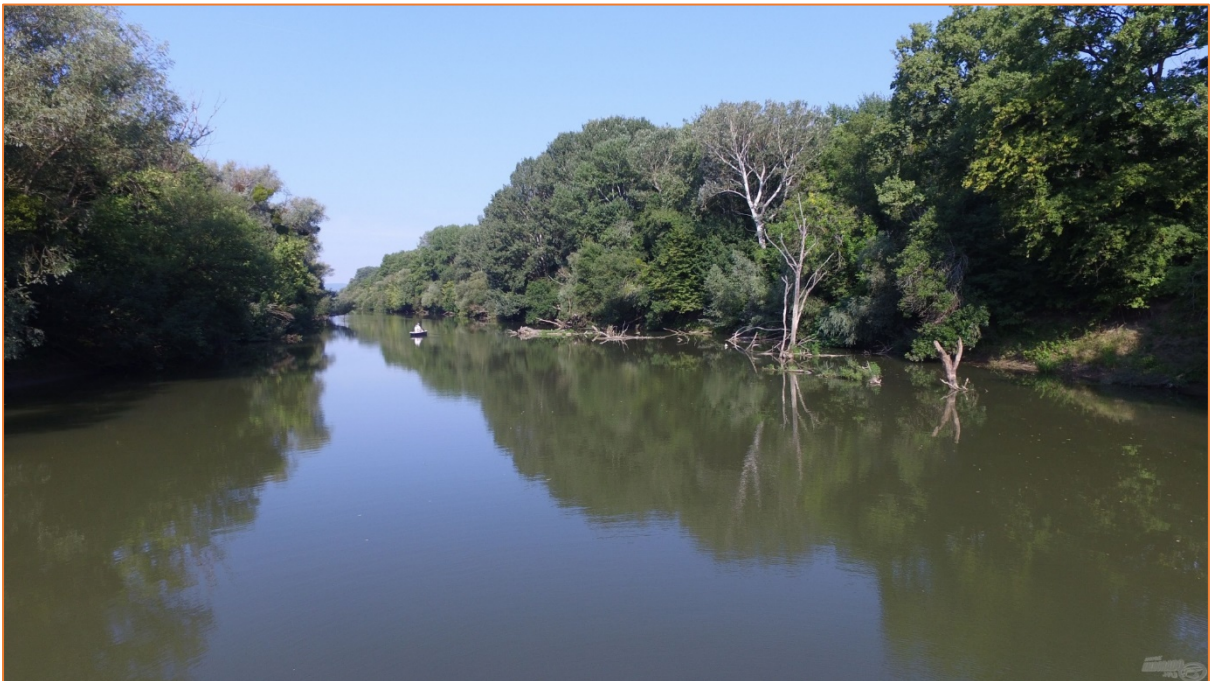
1. kép - Bodrog folyó

A Pallas Nagy Lexikona és a honismereti alpművek több szócikkben foglalkoznak a Laborc folyóval és névadójával. A világhálón fellelhető szövegváltozatok számos hibájának kijavítása és a rövidítések feloldása után a következőket tudhatjuk meg e névről.