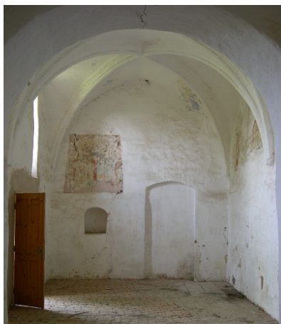
3. kép - Az elhagyott kápolna hajója freskómaradványokkal

A Torna-patak völgyében fekvő Körtvélyes környéke természeti érdekességekben és táji szépségekben bővelkedő karsztvidék. E táj déli részét Aggteleki-karsztnak, északi részét Szlovák-karsztnak is