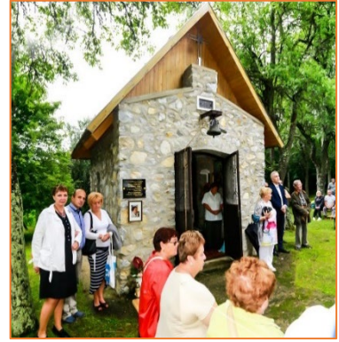
4. kép - Derenki búcsú

hatástanulmányokat elvégezték volna. Ezen vezeték kárpátaljai szakaszán már több törés volt, mely jelentősen szennyezte a felszíni vizeket. Elgondolni is rettenetes, hogy mi történne egy itteni csőtörés esetén, ha a nagy nyomással kifolyó olaj a karsztvidék kiterjedt földalatti barlangrendszerébe jutna. A település közelében, nyugati irányban található a Szádelői-völgy, mely leginkább a Tordai-hasadékhoz hasonlítható szurdok, 300-400 m-es sziklafalakkal. Körtvélyestől délre, a határ mentén, Szádvár közelében található Derenk szellemtelepülés. A környék Horthy Miklós kedvelt vadászterülete volt, ezért lengyel (gurál) lakóit 1943-ban erőszakkal kitelepítették, és a falut lerombolták. A hazai lengyelek 1994 óta, július közepén, a templom helyén épített kápolnánál tarják a búcsút.