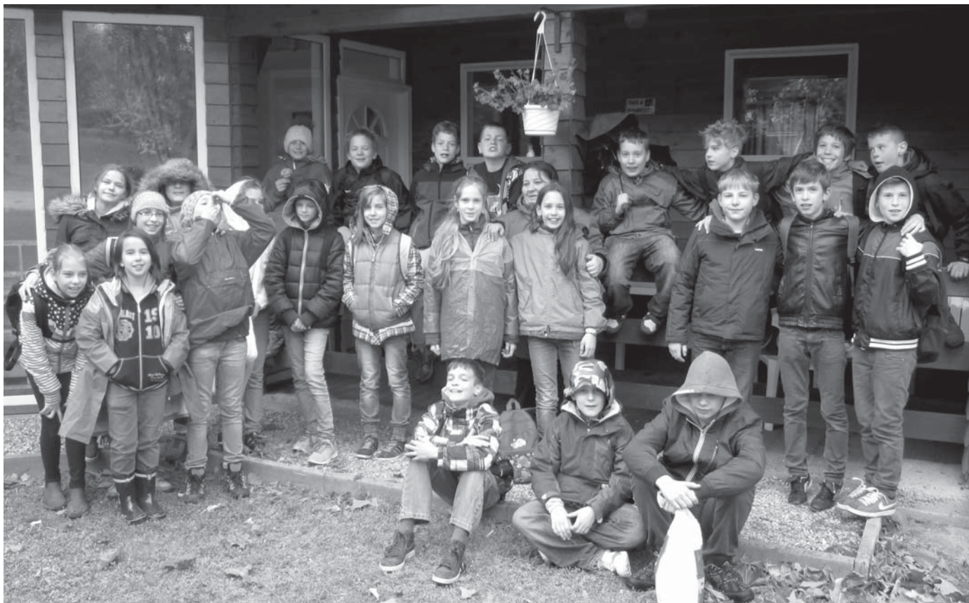
A szokottnál három héttel korábban, a bővös, viharos május közepén mentek osztályaink három napos kirándulásra. Egészségesen tértek baza, néhány nap alatt kipibenték fáradalmaikat, és vidáman számoltak be az erdei iskola programjairól. Képen az 5. osztályosok láthatók, a balatonlellei Kalória Gyermeküdülőkben.