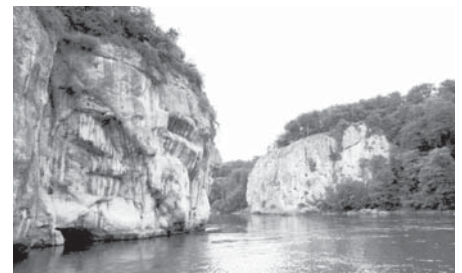
Kelheim - Dunaszoros