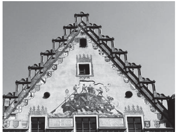
Ulmi Városháza