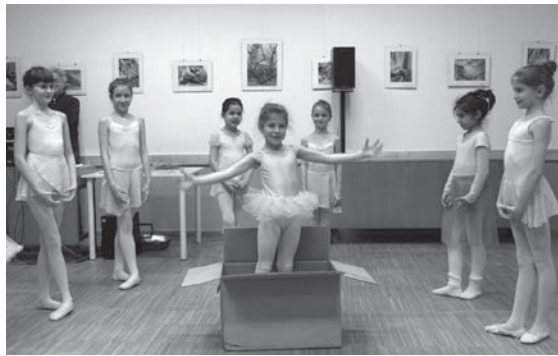
„Körbetiszta Tánc” gyermek és ifjúsági csoport

Kis szusszanás után eljött a jelmezverseny ideje. Úttörő ötletekkel nevettek meg bennünket. Én azért láttam, a győztes nyuszilány nem csak szaladgált, hanem vezette a vadászt, aki a