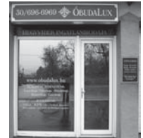
1037 Budapest, Erdőalja út 46.

Hívjon bizalommal! 30-696-696-9, 1-242-1096