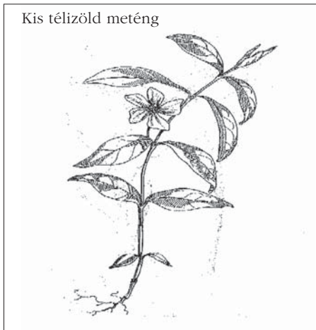
Kis télizöld meténg

Kevésbé ismert a kis télizöld meténg ( Vinca minor L.). Gyertyános-tölgyesekben típusalkotó. Itt a Hegyen is árnyékos helyeken találkozhatunk tavasszal szép világoskék virágaival. Örökzöld levelei télen, nyáron szép díszei a kert helyeinek, síroknak. Indaszerű kúszó és gyökerező szárú növény. Újabban gyógyhatása miatt termesztik is. Szárítva, leveléből főzött teáját a népi gyógyászatban hasmenés, vérnyomás, vizenyő fehérfolyás, mandula-, torok gyulladás, sebek gyógyítására használják. Szárított leveleiből 30-nál több alkaloidot mutattak ki. Gyógyászati jelentősége a vinkaminnak, izovinkaminnak és a vincinnek van vérnyomás csökkentő, agyértágító és vizelethajtó hatásuk miatt. Ezek kiinduló vegyületei a magyar fejlesztésű Cavintonnak.