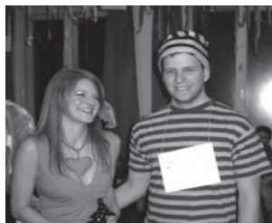
Harmadik: „a szerelm rabja”