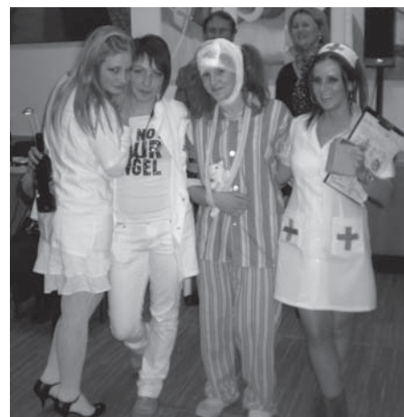
Győztes: „a magyar egészségügy”