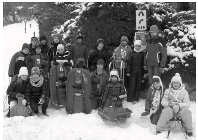
Amint leesett a várva várt hó a gyerekek kimentek szánkózni délelőtt és délután is a közeli rétre. Képünkön a 4. b osztály látható.