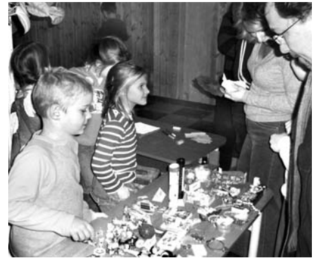
Luca-napi vásár 2007. december 14.

Az új év első napjai ismét komoly feladatok elé állították az iskolában dolgozókat. Január 14-én vizsgáztak a felső tagozatos tanulók: az 5. osztályosok nyelvtanból, a 6. és 8. osztályosok