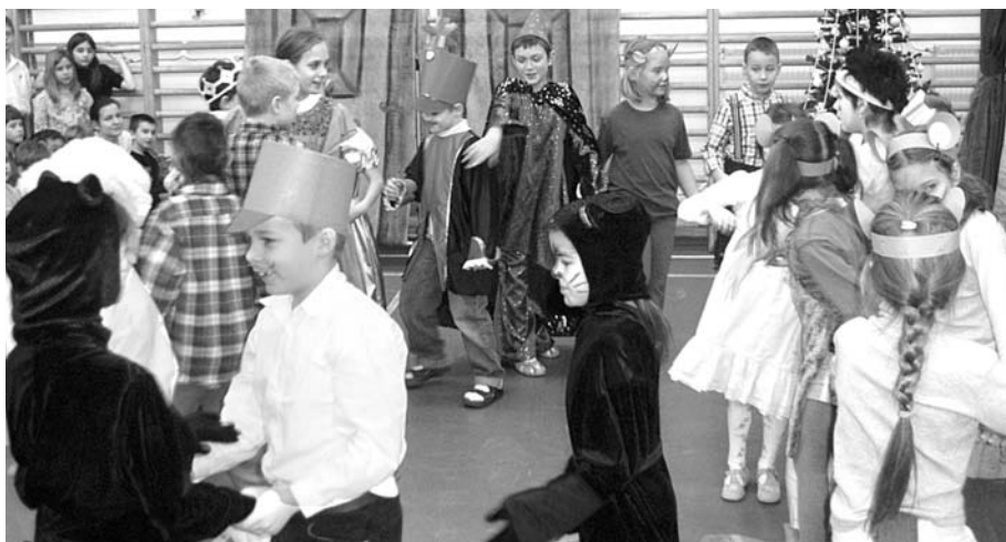
Az iskolai ünnepség fénypontja a Diótörő előadása volt

hónapja, így van ez az iskolánk esetében is. Sok-sok készülődést követően elérkezik a nagy nap, az ünnepség, egymás megajándékozása.