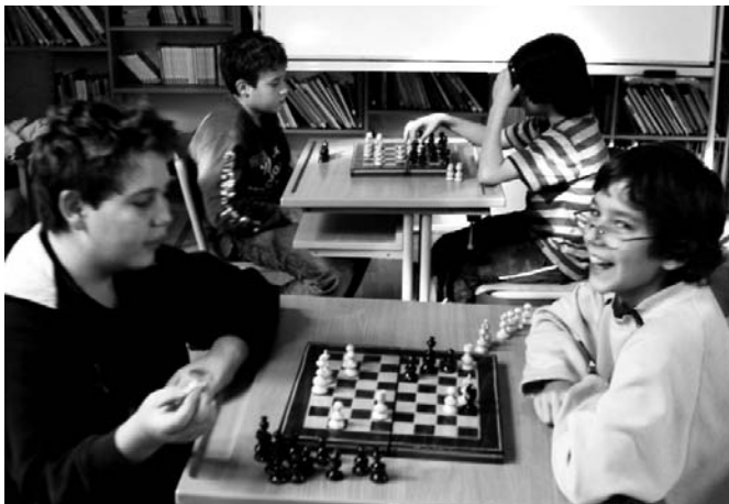
Sakkozók az új játszóházban