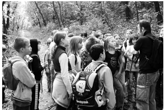
Környezetismeret óra a természetben