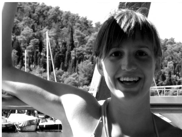
Kata legutóbb Rogoznicánál még megvolt, nagyon jól érezte magát a tengerparton.