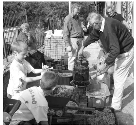
220 kg szőlőből 160 liter must lett. A 40 liternyi maradékot jövőre megkóstoljuk bor formájában – ha sikerül.

Az eddig leírtakból talán már látszik, hogy az Isten, a szem, az átváltozás, a forrás, a bor egy ugyanazon földi misztika szimbólumcsojra. Mert Isten egyenlő a mindent látó szemmel. Elég, ha csak a ke-