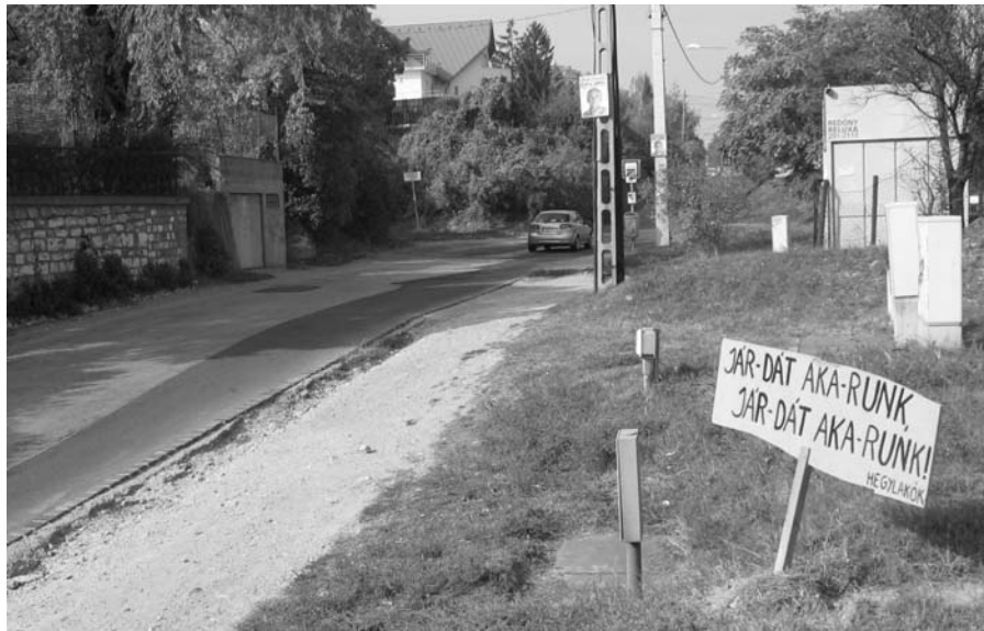
Ismeretlen tettes, ismert vágyat skandál a hegylakók nevében