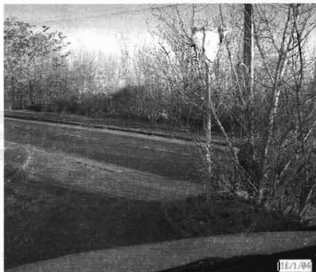
A kereszteződés megközelítése a Zúzvara u. felől, nyáron a tábla sem látszik