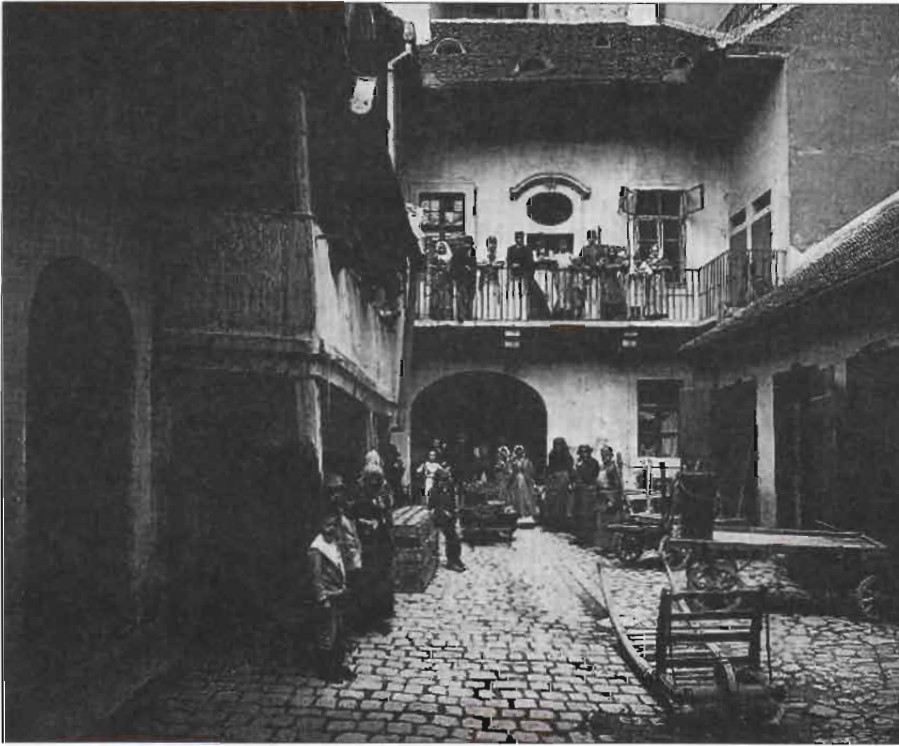
...a ház belső élete is mozgalmas színházat varázsolt elém...

áltozás is, és a madárember, ahogy érkezett, úgy távozott, bicegve, balra el.