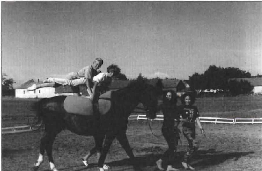
Lovastáborban is voltunk, Szentán

Tájékoztatjuk a hegy lakóit, hogy az őszi papírgyűjtésünk szeptember közepétől október közepéig tart.