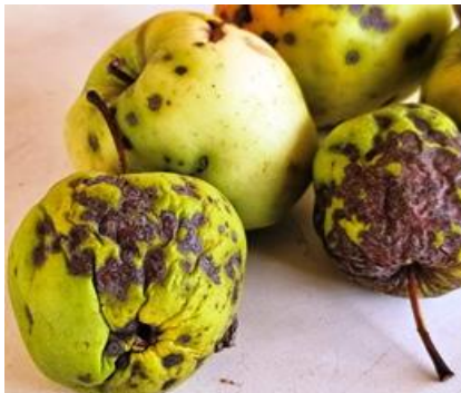
Jó egészséget, jó kertészkedést!