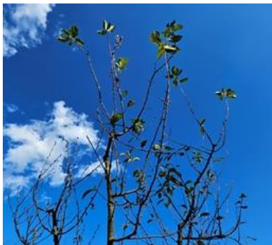
Budapest, 2023. október 17.

► Országszerte indulnak a 80 tanórás növényvédelmi alaptanfolyamok, az ún. „zöldkönyves” képzések . A megyei tanfolyamokról érdeklődjenek a www.magyaroveny orvos.hu oldalon a novemberi fővárosi képzés tájékoztatóját letölthetik innen illetve mellékelem is.