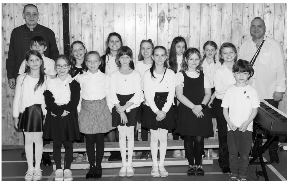
▼ Az énekkar

te meg a gyerekeket a történettel. Az eredeti műben is felcsendülő leghíresebb dalokat élőzenével kísérve adták elő. A gyermekek a színpadi művészekkel együtt énekelve tanulták meg a betétdalokat.