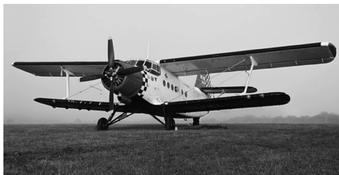
A tragikus sorsú AN-2-es típusú repülőgép.