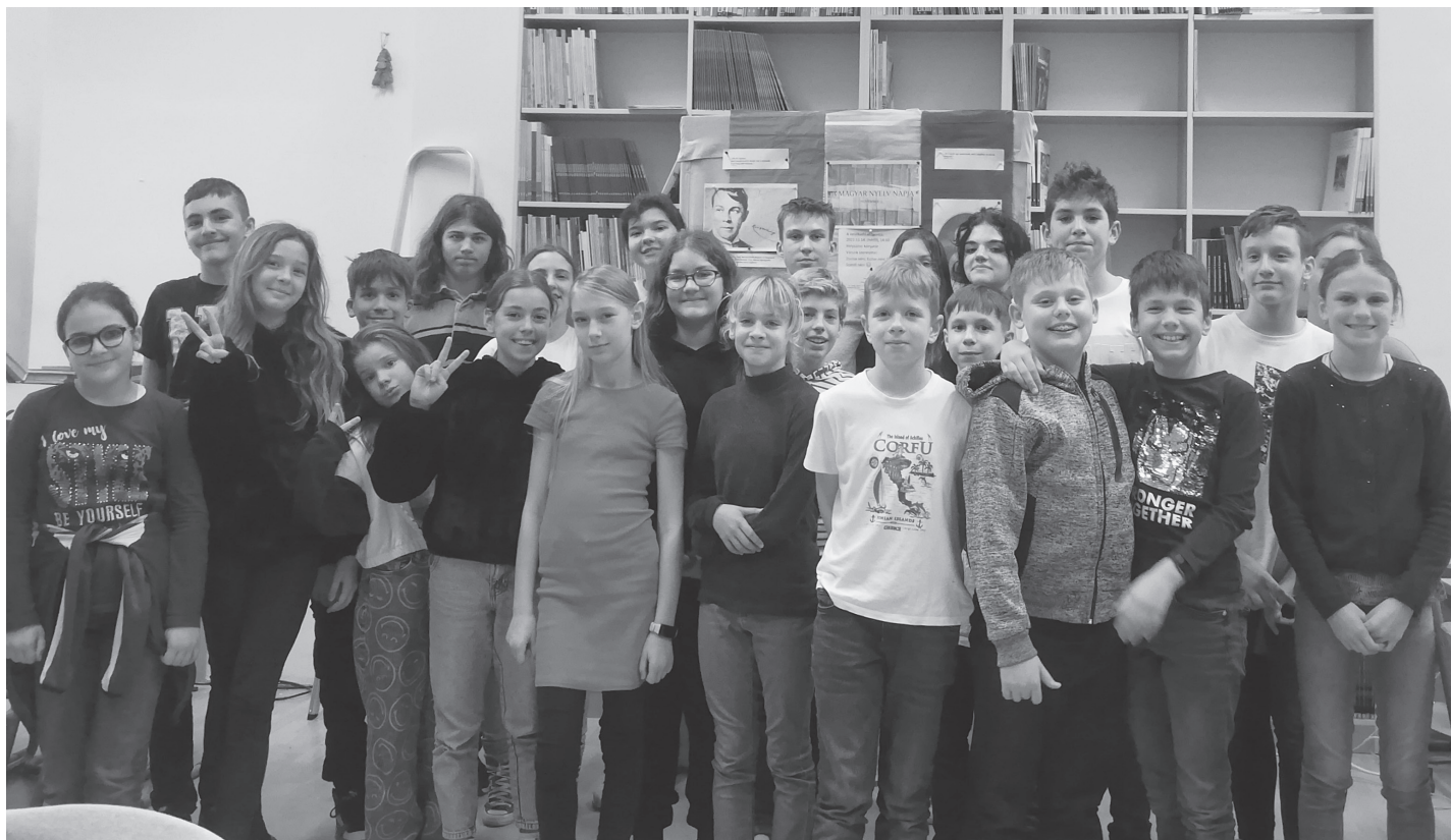
A Magyar Nyelv Napja alkalmából megrendezett iskolai vetélkedőnkön örömkre a képen látható huszonnégy diák vett részt.