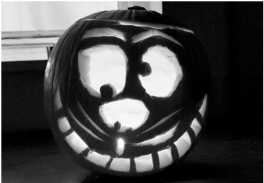
II. díj: Reszketős