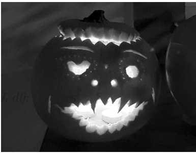
I. díj: Lidérces