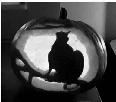
III. díj: Tökvicces