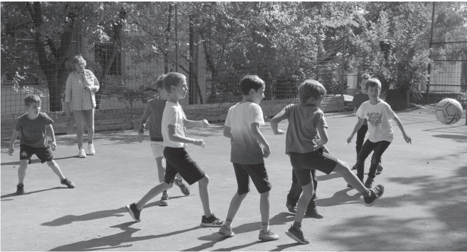
Focibajnokságon a 3. a és b elszánt csapatai megmérkőztek egymással