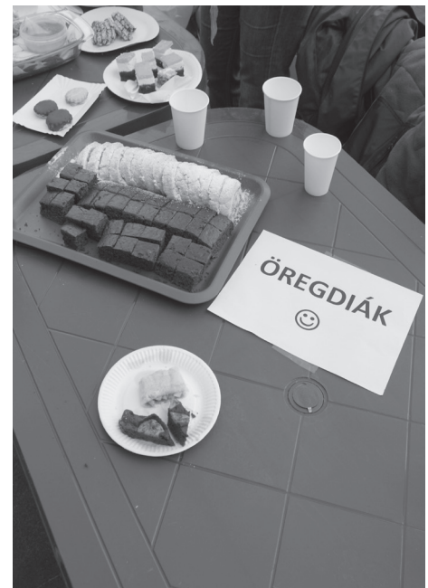
Egy öregdiák süteménye