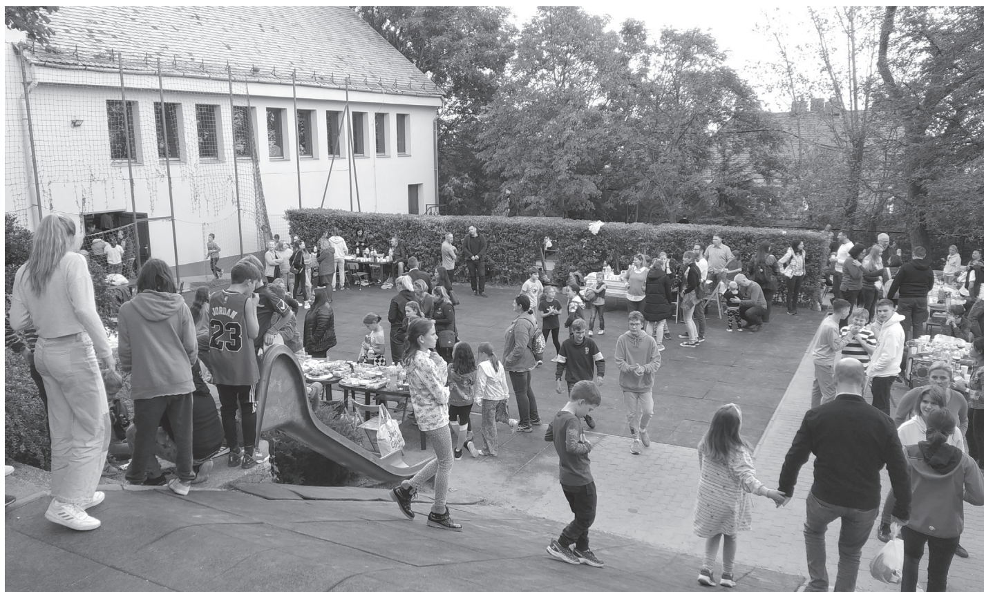
Az iskola alsó udvarán szülők és gyermekek az öregdiákokkal együtt élvezték a napfényes rendezvény minden percét Minden osztálynak volt egy terül, terül asztalkája. Lehetett enni,- inni, jókat beszélgetni, ismerkedni egymással.