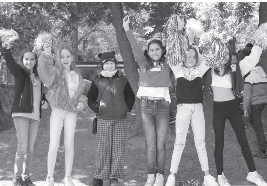
A focibajnokság szurkolói, a gyönyörű pomponlányok

Elnézést kérünk az előző számunk 6. oldalán, a téves képaláírásért. Helyesen: