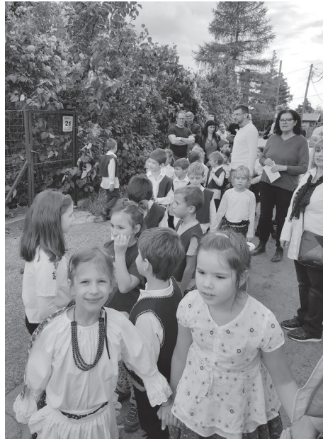
Népviseletbe öltözve tisztelték meg a gyermekek a hagyományörző őszi Suli-bulit.