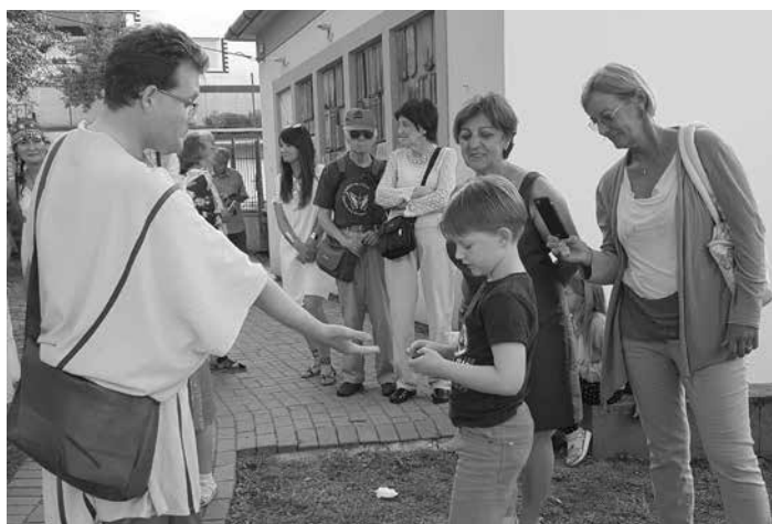
A rabszolgakereskedő átveszi a licitált összeget