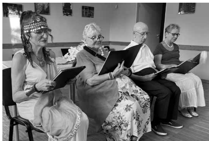
A felolvasó színház versekkel ismerteti, idézi a római kort