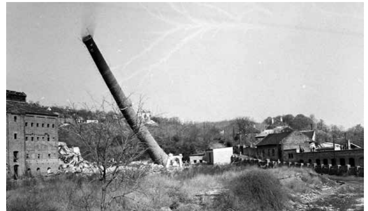
Az elbontott téglagyárak felszabadult területein kereskedelmi létesítmények, lakóparkok valósulnak meg