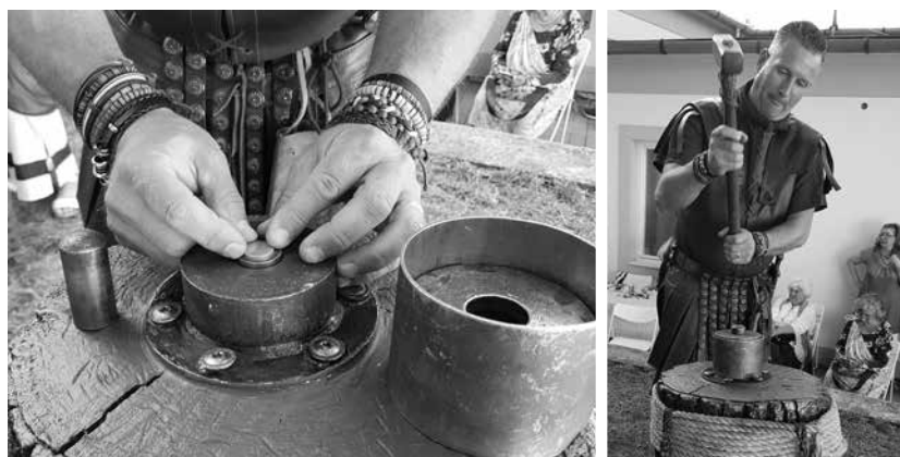
Atillius, a római pénzverő sablonjában Hadrianus római császár dénárját készíti.