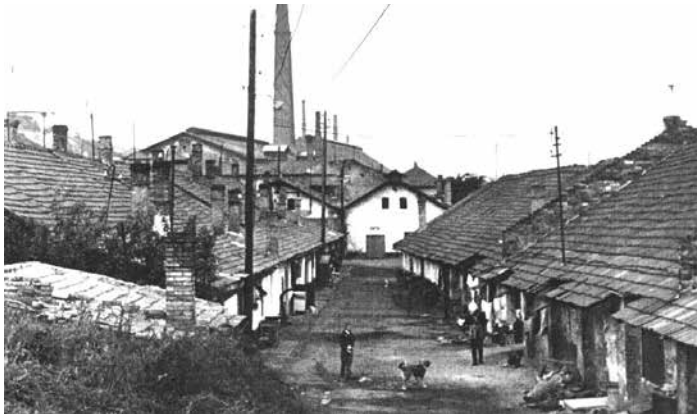
A téglagyári munkások lakásainak (Cegaj) bontásával, megszűnésével nagy területek szabadulnak fel