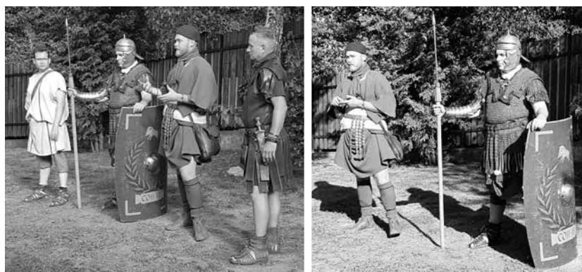
Colonia Rostallo legionariusai a harcászati technikákat ismertetik