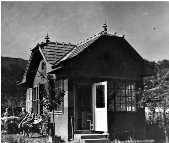
Hétyégi ház a Jablonka út felett