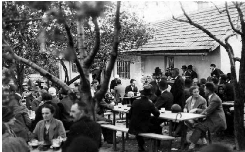
Schusztler vendéglő a Tábor-hegy oldalán, a Toronya utcában