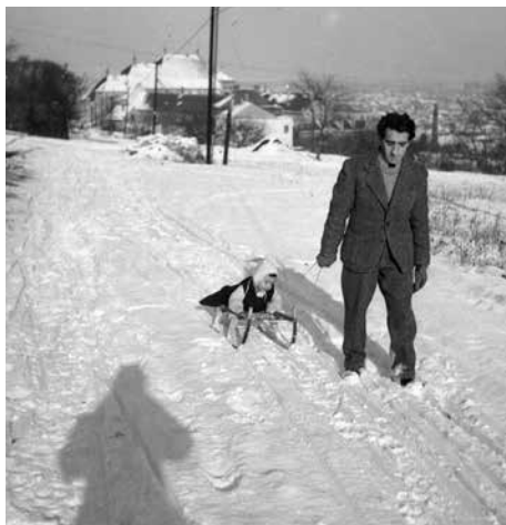
„Kishalál”. A bányaszél kiváló ródlipálya volt, sokadalom idején a vasvázás ródlik miatt kapta a „halál” jelzőt

A telek az 50-es években keményebbek és hóban gazdagok voltak, mint az utóbbi évtizedekben. A Perényi út felső szakasza 2-3 méterrel mélyebben volt a mellette lévő kerteknél. A Bohn (később Újlaki II-es) téglagyár agyagbányája tatóngó mély gödör volt, amely felől a viharos szél a Perényi úton áthatolhatatlan hófúvásokat épített. Gyakran csak egy hét után szabadították