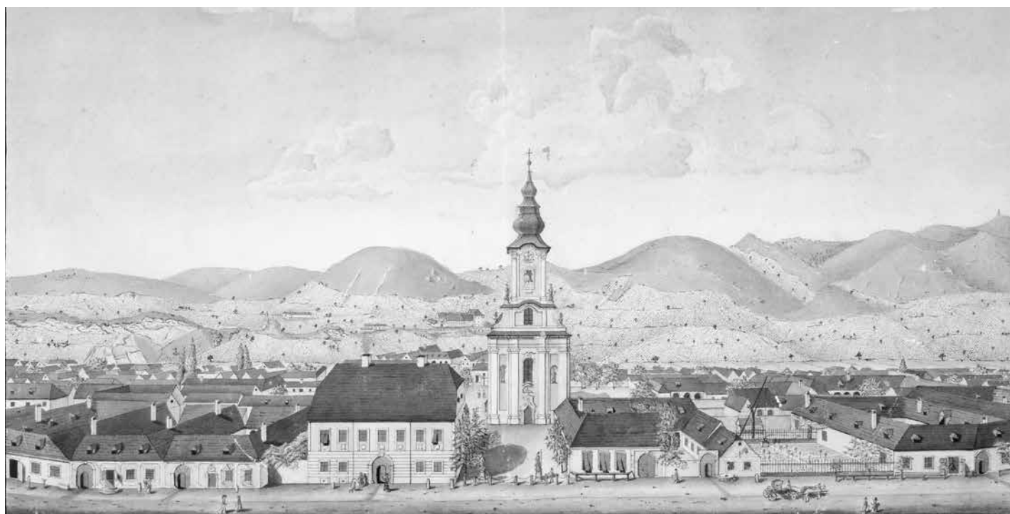
Kollár István 1812-ben készült szépiaraja, amelyen Óbuda házai mögött jól láthatók a hegyoldal szőlőművelés alatt álló területei.