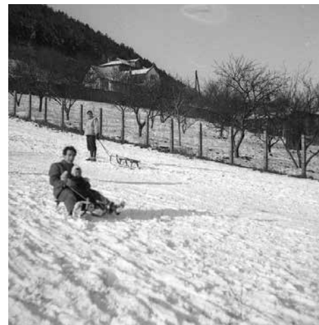
„Nagyhalál” a Remetehegyi út és a Nyereg út között, a Kiscelli Múzeum közelében.