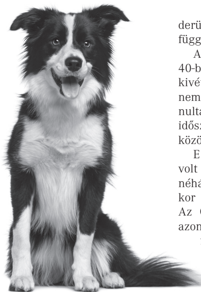
A világ legokosabb kutyája: border collie

A kutyatehetséget az ELTE etológusai vizsgálták. A tehetséget ez alkalommal az emberi