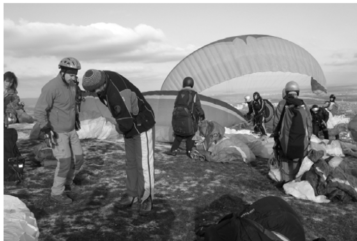
Hármashatár-hegy, a felszállásra várók színes kavalkádja