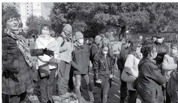
Barangolunk Óbudán – a „Királyok és királynék városába”