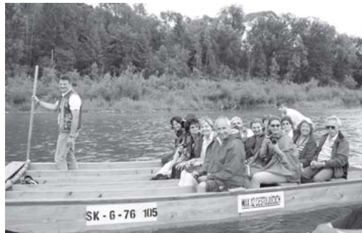
Utazunk magyarul a területekre – itt tutajozunk a Dunajecen