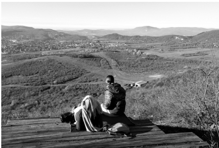
Újlaki-hegy, a sárkányosok ledeszkázott starthelye