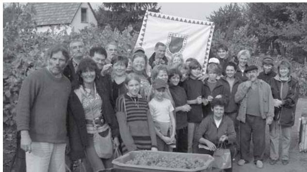
Szüretelünk minden évben, a képen az etyeki szőlődombon