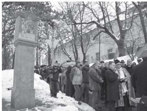
Megújítottuk a Kiscelli keresztutat sokak segítségével