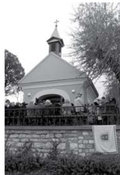
Megújult a Szt. Donát kápolna