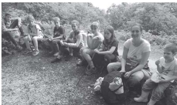
Gyermeknapi túra a Virágos-nyeregbe, egy „Családi vasárnap” alkalmával