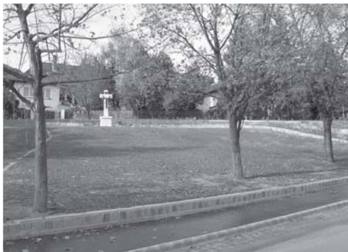
Sittlerakó helyén a Jablonka park épült az Ecker kereszttel