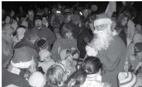
December elején lovon jön a Mikulás a Virágos-nyeregbe