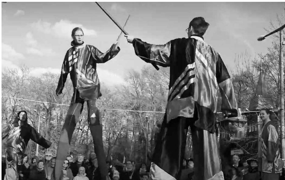
Gólyalábú Konc király és Cibere vajda harca Hévizen