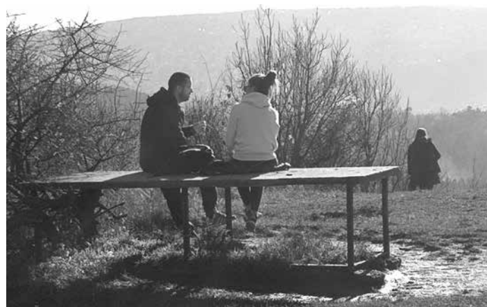
Az egykori fegyvertisztító asztalra - padok hiányában - a fiatalok felülnek.