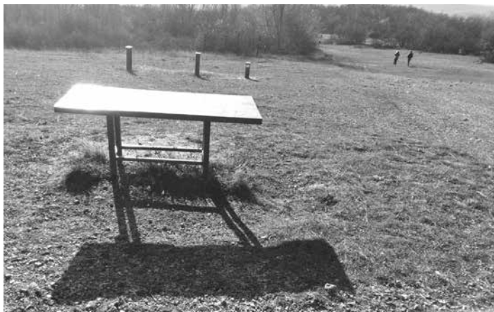
Az egykori fegyvertisztító asztal. Háttérben az egykori akadálypálya bebetonozott acélsövegei láthatók.