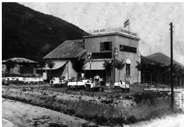
Testvérhegyi Csárda (1933)