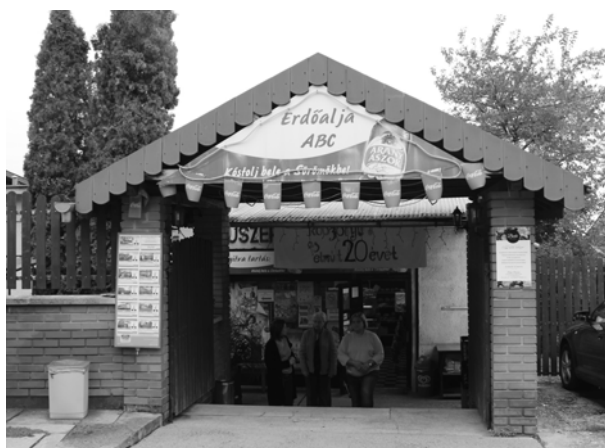
Erdőalja ABC (fotó: 2015)