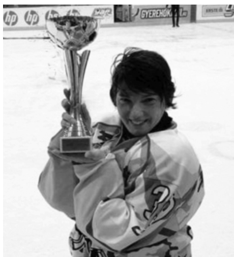
Első helyen a Gerilla csapat! Vagyis én is!