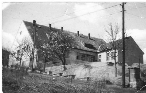
II. Rákóczi Ferenc Általános Iskola (1950)