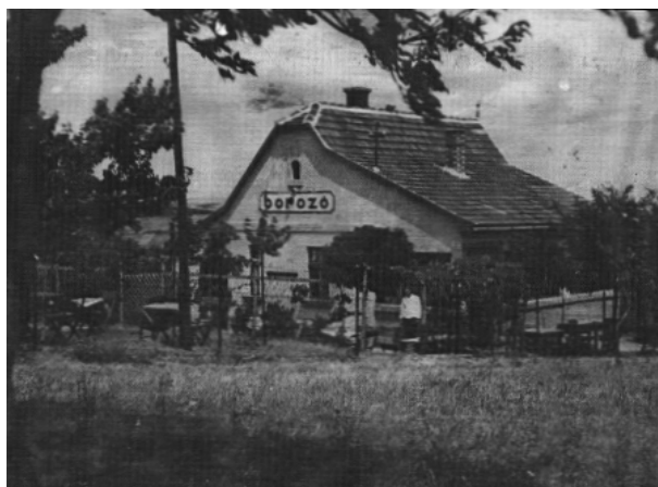
Rosner kocsmá és szatócsüzlet (1950)