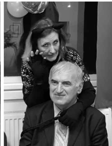
Ildikó, a karmos macska