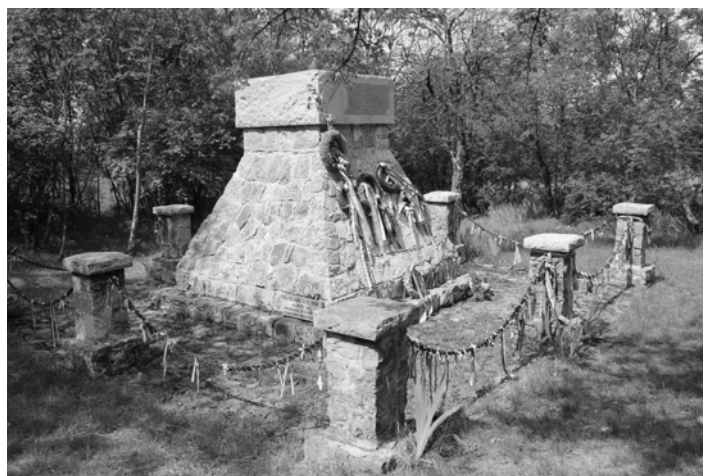
Nagyvárad 4. honvéd gyalogezred katonáinak emlékére épített emlékgúla a Doberdó-fennsíkon