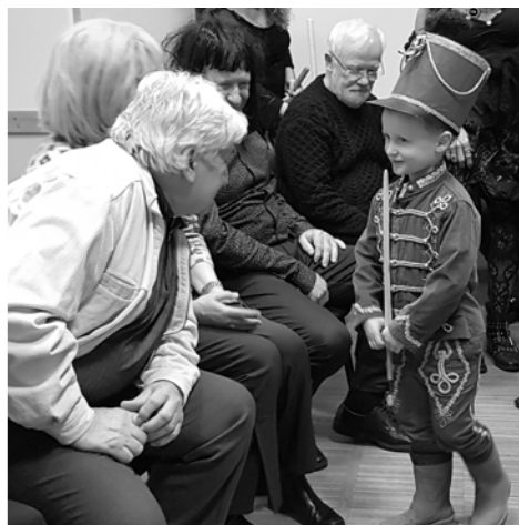
Borsa huszár, Orsi mama mentében