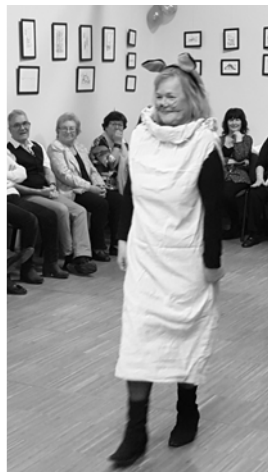
Ica, a Zsákbamacska