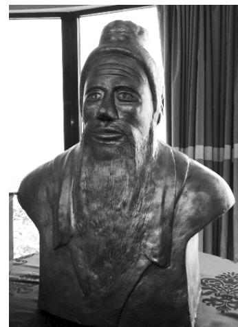
Konfuciusz – Budapest (2015)