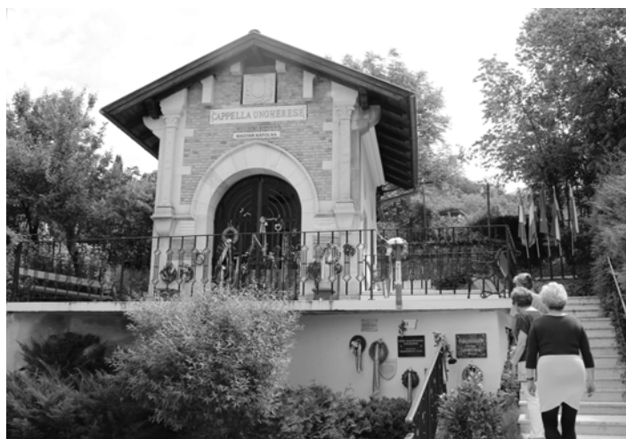
Magyar kápolna az olaszországi Doberdo del Lagohoz tartozó Visintini faluban (felavatta 2009. május 30)