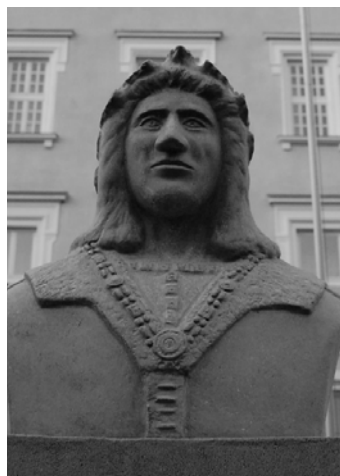
Mátyás király – Kőszeg (2011)