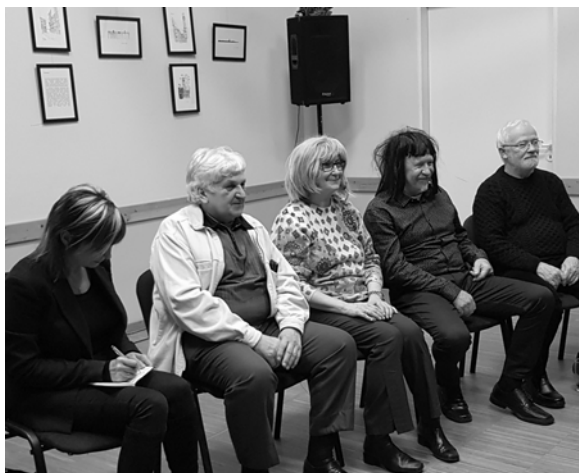
A jelmezverseny zsűrije