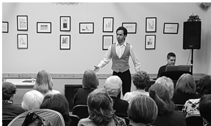
Manuel B. Camino mexikói bassz-bariton

Ezek után már csak a legfrissebbek maradtak a táncparketten, majd fél 2 felé bezártunk. De találkozunk jövőre ugyanitt!