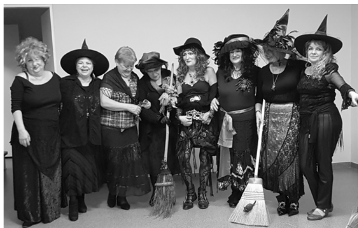
Hegyi boszik vidám kara