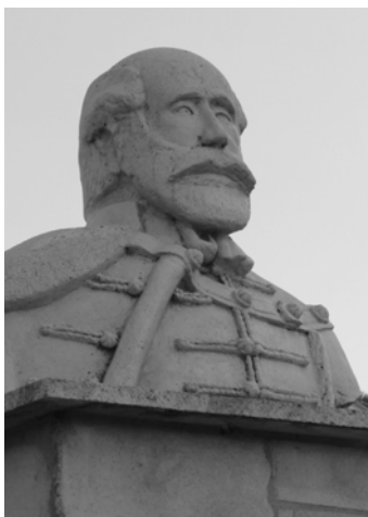
Bathyány Lajos mellszobra (2007)