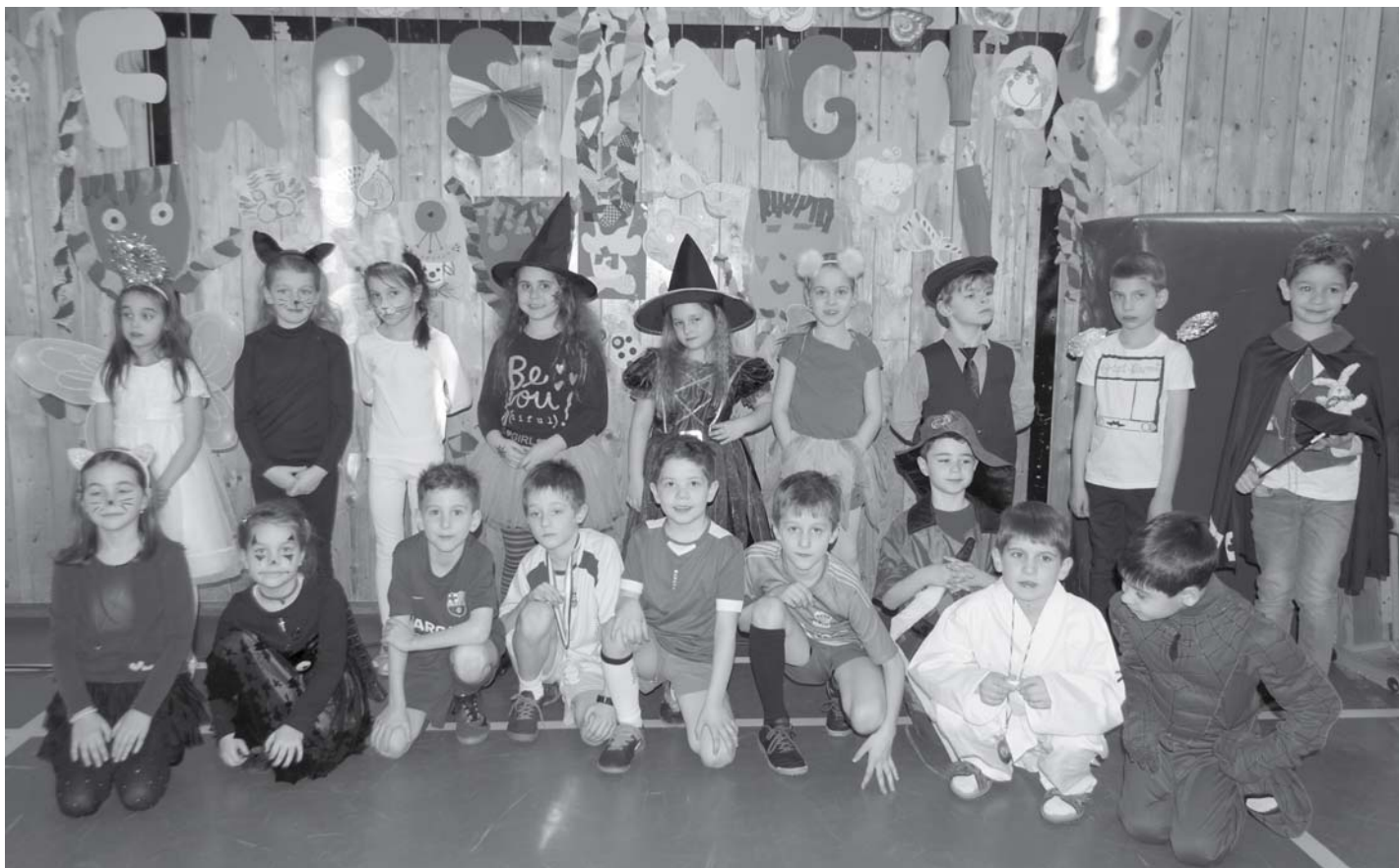
Iskolai Farsang. Az ördöglépcsőkkel, avagy sallangókkal díszített tornateremben királylányok, királynők, pillangók is helyet foglaltak, unikornis, sárkány és egyéb figurák társaságában. Fokozta az élvezeteket, hogy nagy arányban viseltek otthon készített jelmezeket a bálzók.

A foglalkozásokon a gyermek tanuláshoz szükséges képességek - nagymozgások, írásmozgás, beszéd, matematikai készségek, emlékezet, stb. - erősítése, fejlesztése történik.