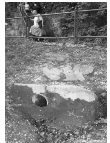
Forráskivezetés a Doberdó sétány alatt