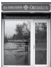
1037 Budapest, Erdőalja út 46.

TESTVÉRHEGY TÁBORHEGY REMETEHEGY MÁTYÁSHEGY ARANYHEGY ÜRÖMHEGY