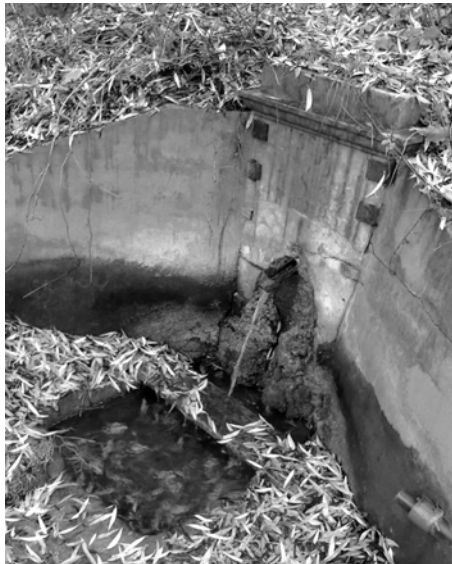
Katalin forrás

A Csúcs-hegy magasabb részein egykoron még voltak kutak, amelyek mára teljesen elapadtak. Az alsóbb szintek lösszel és lejtőtörmelékkel fedett részein, a kiscelli agyag felszínén fakadnak a hideg rétegforrások, mint a Katalin-forrás is.