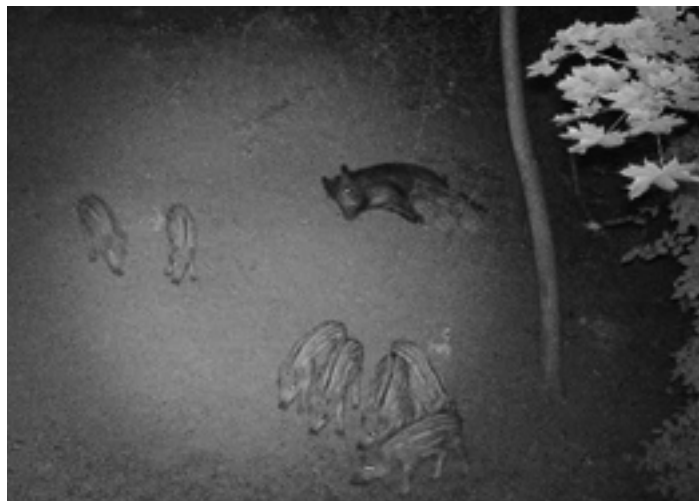
Kamerafelvétel - Tavaszi szaporulat Csíkoshátúéknál a hegyen

- A kertés ingatlanokon élők kertjükben gyakran alakítanak ki komposztáló dombokat, vagy kerítésen kívül helyezik el a lehullott gyümölcsöt, kerti hulladékot. Ahol közel van az erdőhatár, ott az ilyen lerakatok természetes gyűjtőhelyei a földigilisztáknak, kistrágyaszóknak, amelyek a vaddisznó részére ízletes élelemforrást jelentenek.