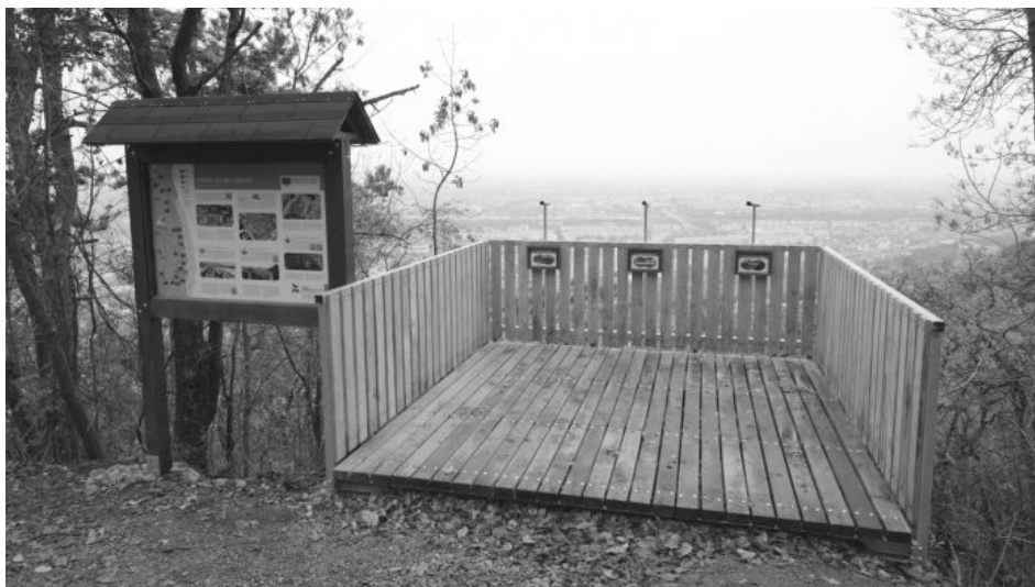
Kilátó terasz a sétány mentén, Óbuda felett

A kiváló magyar erdőmérnök, Guckler Károly (1858-1923) 1895-től lett Budapest Székesfőváros erdőmestere, majd az Erdészeti Hivatal vezetője. Elsődleges feladata, a Budai-hegység fairsításainak megállítása és a károk helyreállítása volt. A nagymértékű erdőpusztulást, a lakosság tűzifaigénye okozta, amelyet a kopár hegyvidék kiábrándító látványa jelzett. Guckler komoly energiát fektetett a munkájába és bátran nyúlt új, modern ötletekhez. Nem a hagyományos tölgyerdő visszaültetését erőltette, hanem főleg feketefenyőket telepített a régi helyébe. Ez a fajta meghálálta a bizalmat és jó tűrőképességének köszönhető,