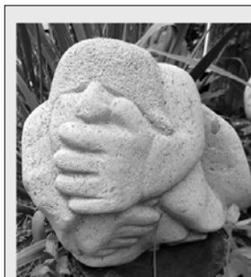
Műélvező (vulkáni kő)