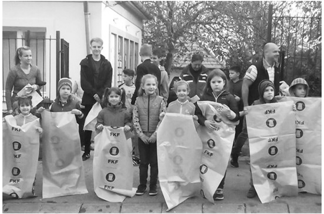
Őszi takarítás: Idén az elsősök jelentős számban, szüleikkel együtt résztvettek a munkában.