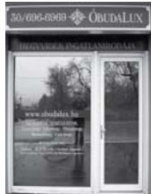
1037 Budapest, Erdőalja út 46.

TESTVÉRHEGY TÁBORHEGY REMETEHEGY MÁTYÁSHEGY ARANYHEGY ÜRÖMHEGY