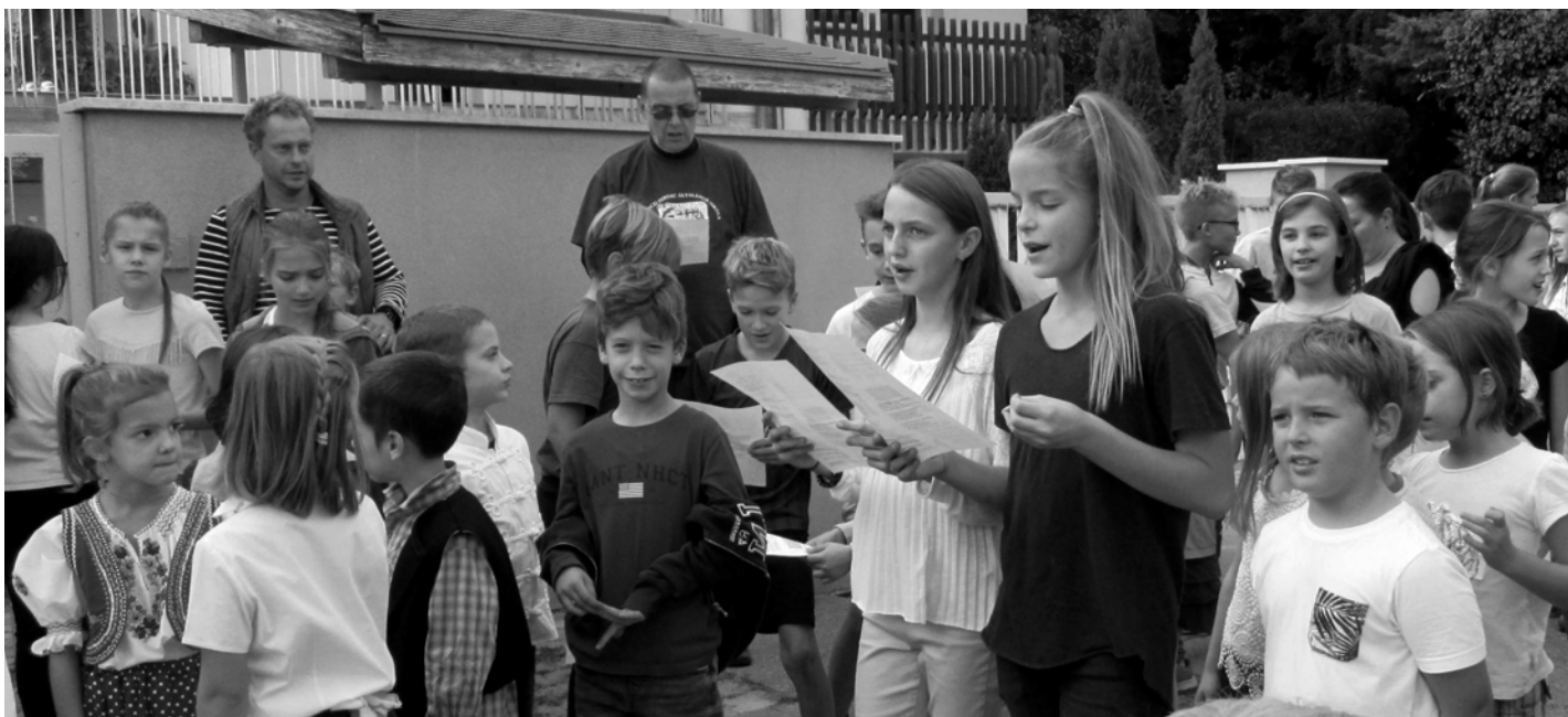
Felvonulás közben énekeltünk, aztán meg-megálltunk, szusszantunk, erőt nyertünk, aztán hangosabban zengett az ének. Persze a hatodikos nagylányok vitték a prímet, a kisélsősök pedig csodálva nézték őket. Hátul az igazgató úr is velünk énekelt.