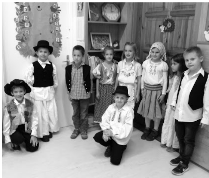
Az elsős felvonuló csapat készül az indulásra a termük ajtajánál. Van izgalom, hiszen még nem vettek részt hasonló eseményben.