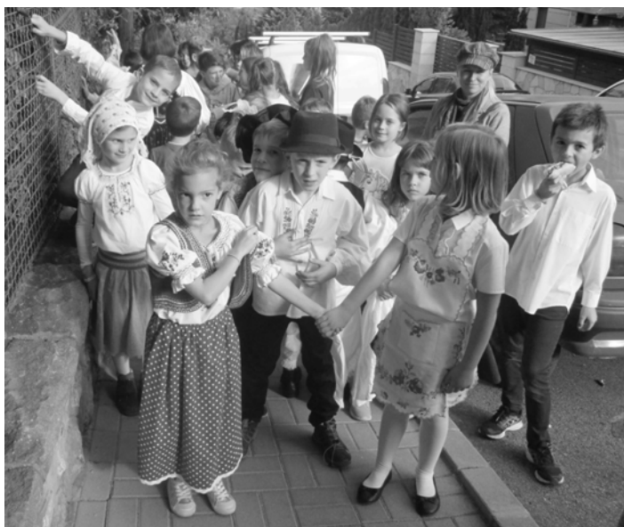
Gyülekeznek a gyönyörű ruhába felöltözött elsősök az énekes felvonulásra. „Érik a szőlő, hajlik a vessző...” - zengett az ének.