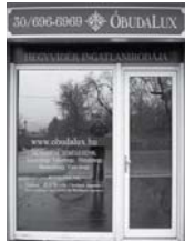
1037 Budapest, Erdőalja út 46.

TESTVÉRHEGY TÁBORHEGY REMETEHEGY MÁTYÁSHEGY ARANYHEGY ÜRÖMHEGY