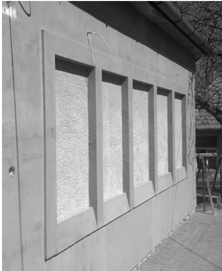
Helytörténeti kiállításra előkészített homlokzat

A jó idő beálltával megkezdtük a Táborhegyi Népház homlokzatának felújítását, a helytörténeti kiállítás helyének kialakítását. Az egykor átvett, elhanyagolt épületen felújításokat, átalakításokat elsősorban belül végeztünk, a külső homlokzaton csak fenntartási munkák történtek. Most azonban nem lehetett tovább halasztani. Mindez alkalmat ad arra, hogy a Belső-Óbudai téglagyárakról állandó, kültéri kiállítást építsünk, a székház déli homlokzatán.