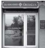
1037 Budapest, Erdőalja út 46.

150 aktuális ingatlant kereső ügyfél, 300 eladó vagy kiadó ingatlan ajánlat