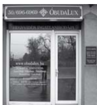
1037 Budapest, Erdőalja út 46.