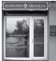
1037 Budapest, Erdőalja út 46.