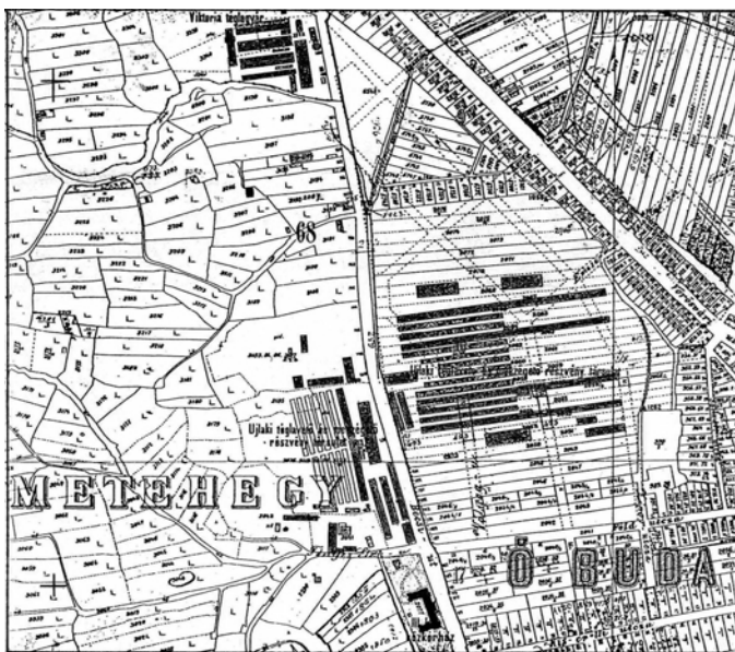
Az 1895-ben készült térképen, a Bécsi út hegy felőli oldalán, jól látszik a Zichyék által alapított Kiscelli Téglagyár, mely ekkor már az Újlaki Rt. tulajdona volt. Bécsi úttól nyugatra az Újlaki Rt. cserépgyára, keleti oldalán az ún. „alsó gyár”, ahol az egykori mezőgazdasági területen téglaszárítók és téglágetők épültek.

Feneberg-Újlak Kft. műszaki átadási jegyzőkönyve alapján)