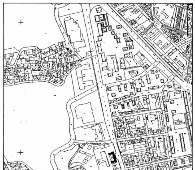
A 2008-ban készült térképen jól látható az elmúlt évtizedben épült Szakközépiskola, Praktiker áruház és a Stop&Shop áruház. Az „alsó gyár” helyén pedig lakótelepek épültek. A hegyoldalon régi utcák egy része eltűnt. Új utca a Perényi lejtő, és a Váradi utca, mely a legújabb tervek szerint a Kolostor utca irányában kiépült.