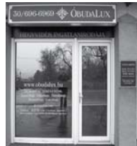
1037 Budapest, Erdőalja út 46.

150 aktuális ingatlant kereső ügyfél, 300 eladó vagy kiadó ingatlan ajánlat