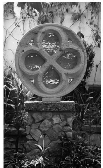
Kontur András: Rózsaablak

A pályázaton való részvétel módja kétféle. A jelentkezési