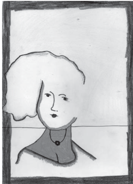
Mibálszki Móric rajza