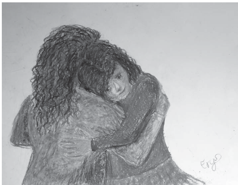
Vajgel Maya rajza