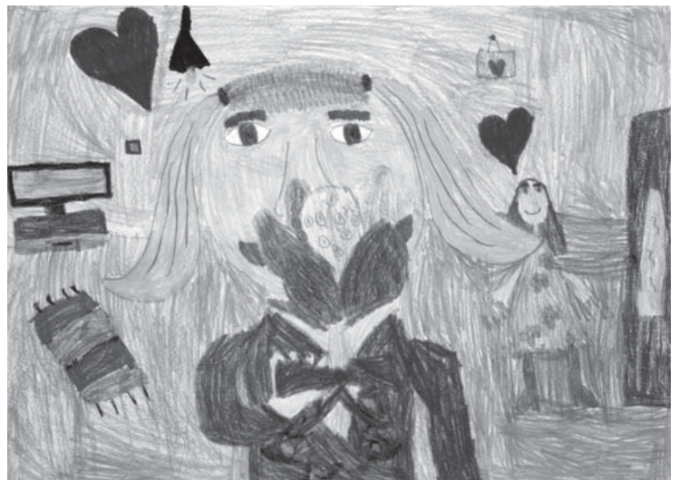
Gévai Dorka rajza