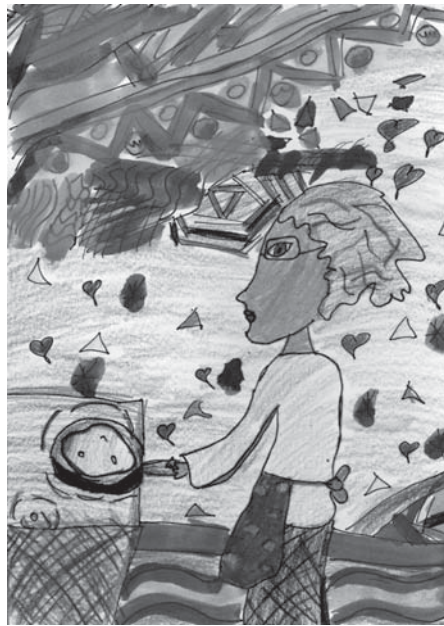
Duca Anasztázia rajza