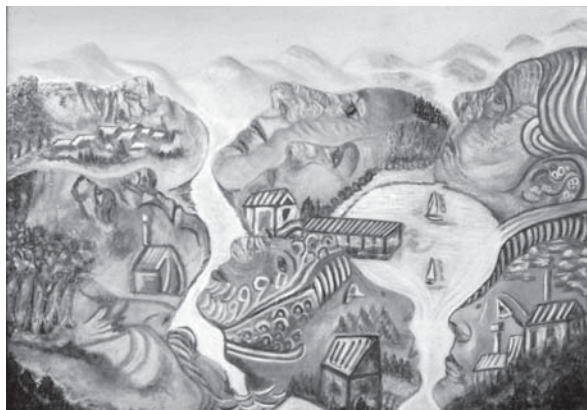
Raksányi Éva - Profilok