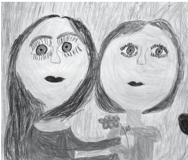
Koós Kira rajza