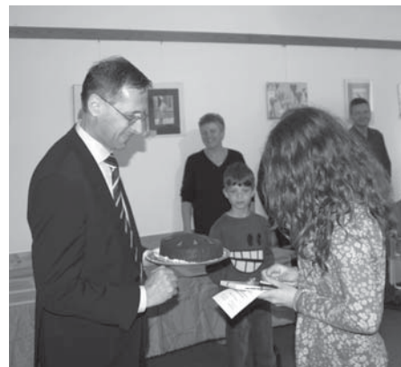
Vajgel testvérek a Miniszter úrtól tortát kaptak jutalmul