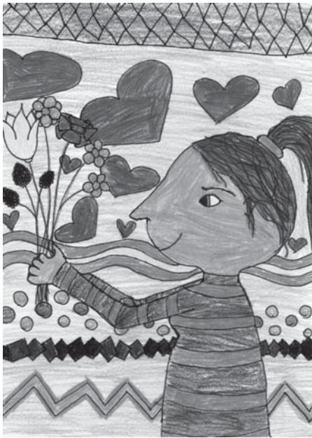
Szalai Júlia rajza