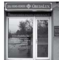
1037 Budapest, Erdőalja út 46.

Hívjon bizalommal! 30-696-696-9, 1-242-1096