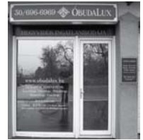
1037 Budapest, Erdőalja út 46.

Hívjon bizalommal! 30-696-696-9, 1-242-1096