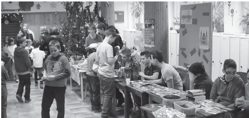
Igazi vásári forgatag lepte el az iskola előterét. Az asztalokra kipakolt kínálat sokakat vásárlásra készítetett.

meg a közönség az előadást. Büszkék vagyunk rá, hogy iskolánkban ilyen tehetséges, kreatív pedagógus kolleganő tanít, aki maga ír, rendez darabot a diákjainak.