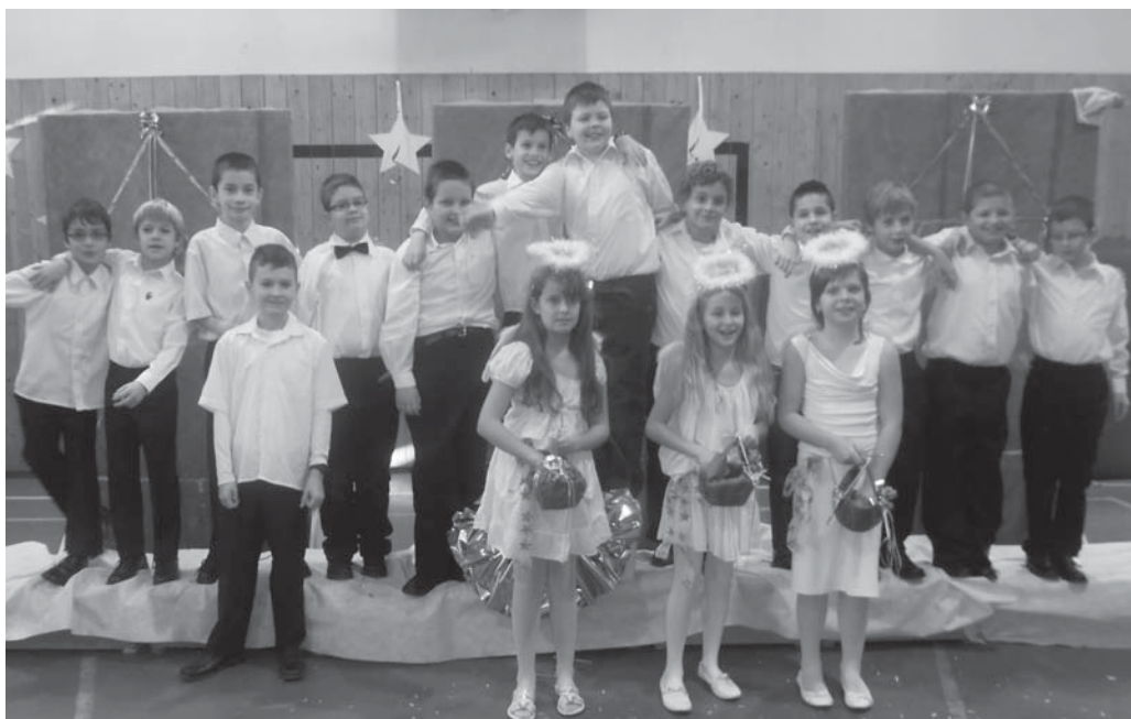
Az egész iskola ünnepelte a 3. b osztály nagyszerű előadását. Igazi karácsonyi hangulatot varázsoltak elénk.