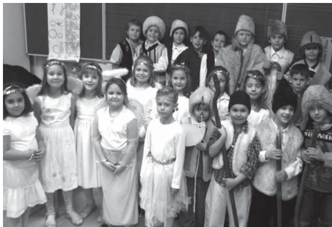
A képen az 1. b osztály mosolygós angyalkái és tiszta szívű pásztorai láthatók. Az elsősök a nagyszülők, szülők, testvérek részére készültek egy pásztorjátékkal. Az izgatott készülődést, próbákat, szereptanulást siker koronázta, karácsonyi éjszakát varázsoltak a könyvtárba egy decemberi békézőnap délutánján.