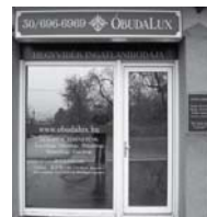
1037 Budapest, Erdőalja út 46.

www.taborhegyi.hu www.remetehegyi.hu www.matyashegyi.hu