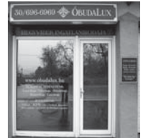
1037 Budapest, Erdőalja út 46.

www.obudalux.hu www.taborhegyi.hu www.remetehegyi.hu