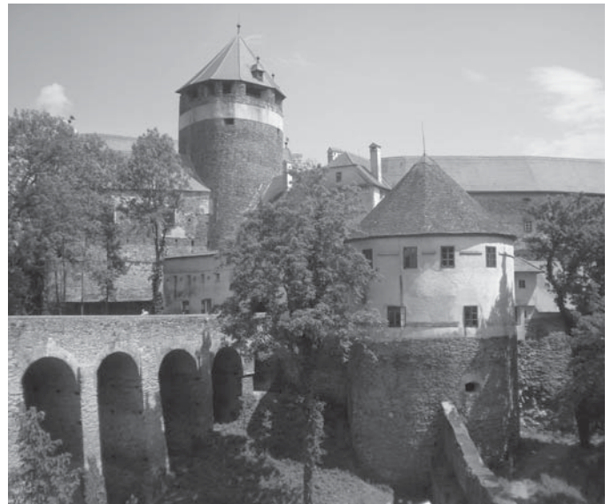
A külsőtornyos Szalónak vára a középkor óta szinte teljes épségben fennmaradt. Kapuját 12 pilléren nyugvó hídon lehet megközelíteni.

Lackenbach (Lakompak) és Kobersdorf (Kabold) fölkeresése előtt keresztül-kasul bejártuk Fraknó várát. A teljesen épen meg-