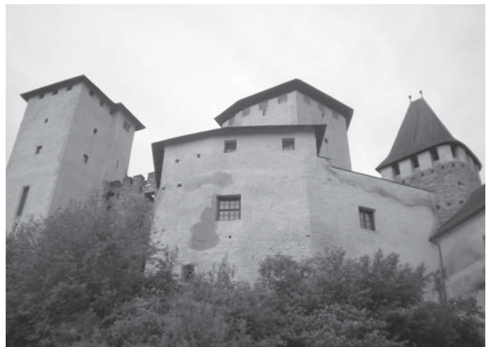
Léka várának falai a XIII. századból, a Gyöngyös patak kanyarulatában.