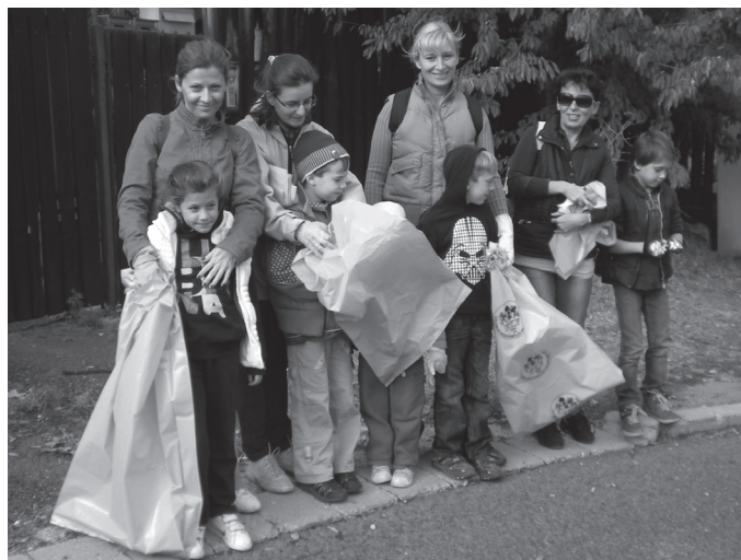
Az őszi takarítás munkájából az elsősök is kivették részüket. Noszogatók nélkül, vidáman gyűjtötték zsákokba az utcára nem illő papírokat, flakonokat.