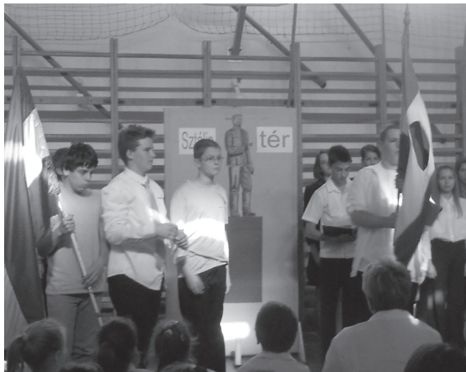
A forradalomra emlékezve a nyolcadikosok adtak nagy sikerű műsort.

Kedves szomszédunk mutatta be ezt a kis könyvet, nekünk, többieknek, amikor a fenti téma szóba jött. Ha valaki szívesen olvasgatna Iskolánkról a kezdetektől, amikor még csak földszintes volt a nagy háború után, majd a romokból a hegyi lakók, és a kerület vállalatainak munkásai segítségével felépült, az