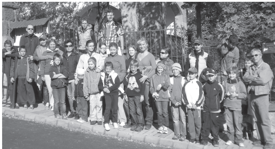
Környezetvédők gyülekeztek az Erdőalja iskola előtt.