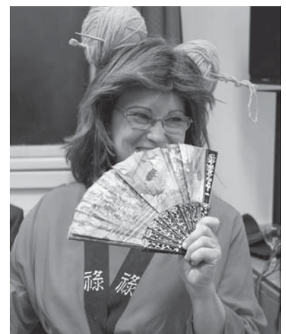
Felhött farsangoló a mosohyógó a japán gésa