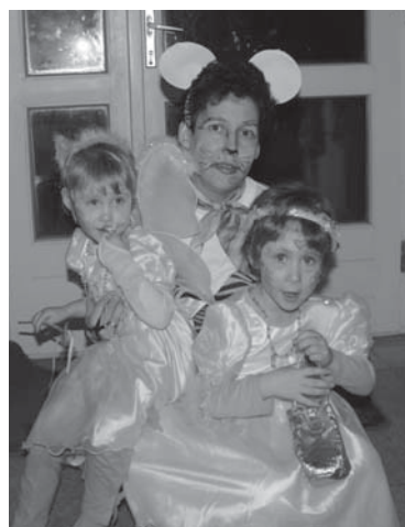
Farsangi jelmezeseik közül két angyalka