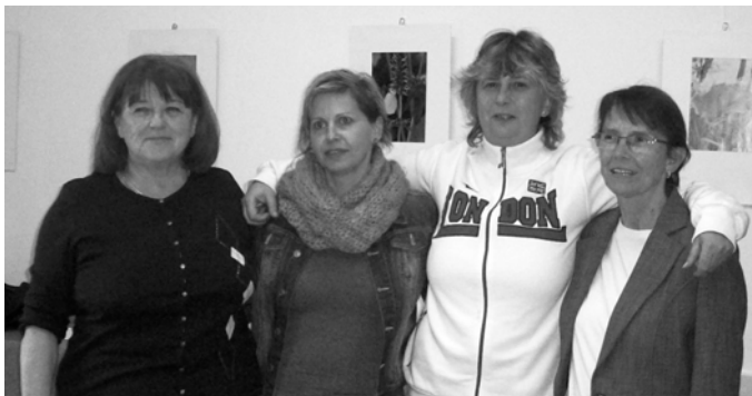
Hazai második helyezett csapat

Legutóbb beszámoltam a Nagykanizsai kiruccanásunkról, amely annyira jól sikerült, hogy ott helyben felvetettük, hogy mi is szervezhetnénk egy hasonló versenyt. Ezt az elhatározást tett követte. Október 16-17-ei hétvégén megtartottuk a Csapatversenyt. A győztes egy vándorkupát kap, amelynek birtoklásáért mostantól kezdve minden évben újra lehet küzdeni. A versenyen a hazai klub 4 csapatán kívül, Nagykanizsa két együttese, Dunaújváros, Jászberény és Tatabánya csapata indultak. A megjelentek nagyon elégedetten távoztak. Külön öröm, hogy olyanok is jelentkeztek, akik eddig még nem próbálták ezt a versenyformát. A győztesek: Nagykanizsa 1-es számú csapata, majd a Budai Motorosok (a mi klubunk) két csapata holtversenyben. A vándorkupán kívül az első, második és harmadik helyezettek kisebb kupát is hazavihettek.