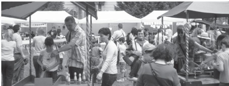
Kerületi civil szervezetek találkoztak a Zichy-kastély udvarában május 2-án, az Óbuda Napján.