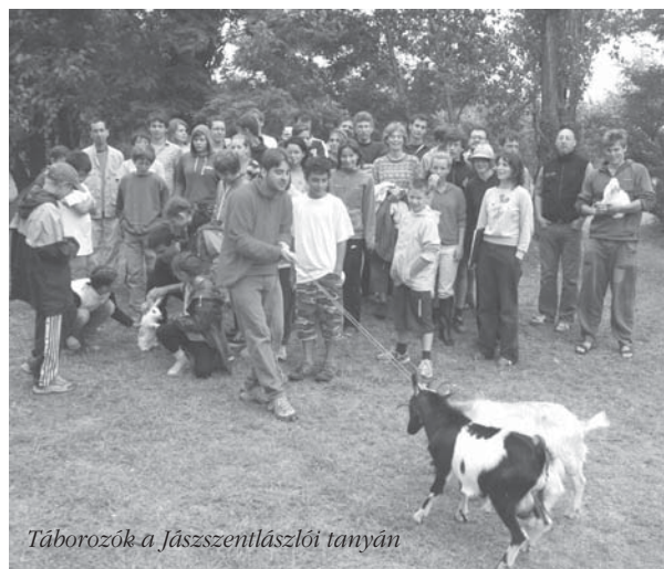
Táborozók a Jászszentlászlói tanyán