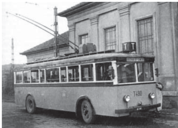
Budapest első trolibuszvonala Óbudán a Bécsi úton létesült 1933-ban, a Vörösvári út - Temető végállomásokkal.

Köztemető útvonalon. A 2,7 km hosszúságú „pályán” hétköznapokon egy, vasárnaponként három