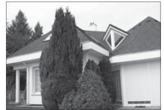
Az óbudai hegyvidék egyik legjobb telkén, úszómedencés, luxus családi ház eladó, ára: 179 millió Ft Tel: 06 30 40 22 800

Iroda: Farkastorki út 1. info@obudahegyvidek.hu Telefon: 240-8018