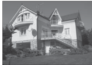
Táborhegy csendes utcájában, nagyon igényes családi ház, szép kerttel eladó, ára: 130 millió Ft Tel: 06 30 402 1444