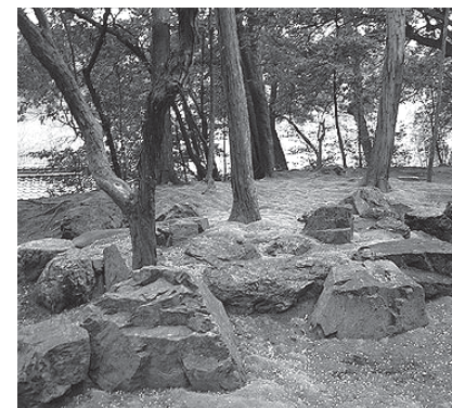
A Saibo ji, a Nyugati Paradicsom kertje - 1339