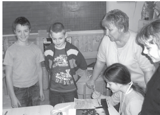
Mónika néni a negyedikesek közt

A beszélgetést lejegyezte: Babiczky László